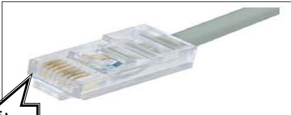
وصلة RJ 45